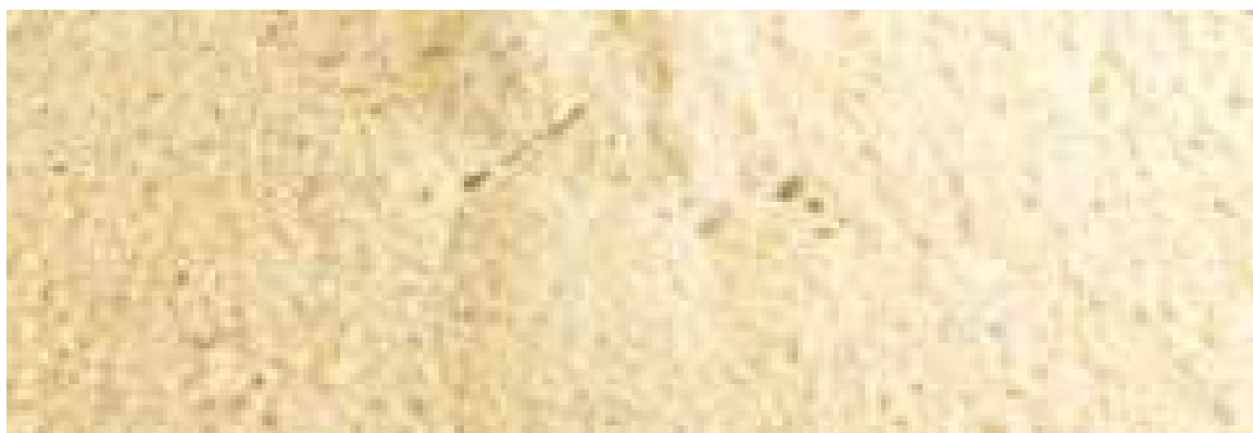
Probiotica in poedervorm

We hebben het nu over melkzuurbacteriën. Ze komen dus vaak van koeien. Deze goede bacteriën komen in de maag van de duiven terecht. In de maag is er een zuur milieu. Zeg maar een heel lage pH-waarde. Bij duiven is dat ongeveer 2 pH. De meeste bacteriën overleven dat niet. Enkele komen er wel doorheen en kunnen dan de goede bacteriën die al in de darmen zitten helpen om de slechte bacteriën te doden. Het valt dus niet mee om de probiotica in de darmen te krijgen. Daarvoor moeten ze al vanaf het begin heel sterk zijn. Als de basis goed is, heb je de meeste kans dat ze de darmbacteriën kunnen helpen.