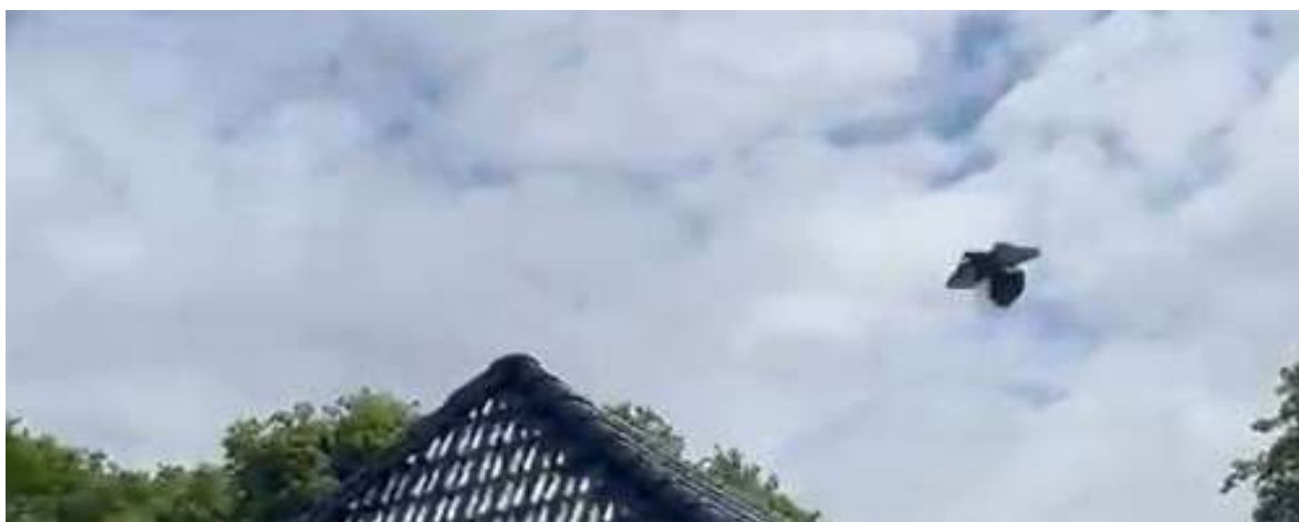
Duif komt thuis van de vlucht

Volgens deze groep neemt live tracking ook een belangrijk deel van de spanning weg. Wanneer men weet dat een duif van hen bijna thuis is, verdwijnt de verrassing van het plotselinge verschijnen aan de horizon. Juist dat onverwachte moment zorgt voor veel liefhebbers voor de grootste emotionele beloning. Vooral bij marathonvluchten wordt het thuiskomen van een duif door tegenstanders omschreven als een emotioneel hoogtepunt. Dat gevoel zou minder intens worden wanneer de volledige vlucht al live gevolgd is.