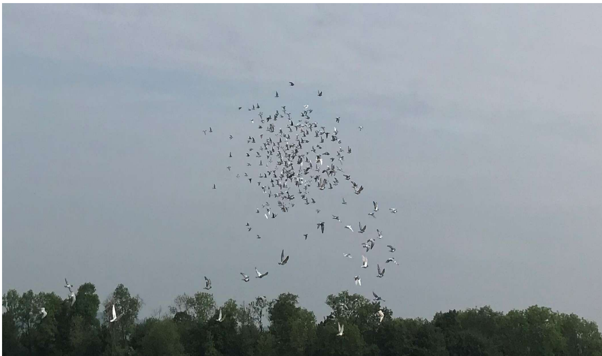
Duiven onderweg tijdens een vlucht

Volgens de voorstanders biedt de komst van realtime trackers in de duivensport vooral kansen. Niet alleen om de sport moderner en aantrekkelijker te maken, maar ook om meer inzicht te krijgen in het gedrag van de duif zelf. Waar tegenstanders vrezen dat technologie iets wegneemt van de traditionele spanning, zien voorstanders juist mogelijkheden om de sport beter aan te laten sluiten op deze tijd. “De maatschappij is veranderd. Mensen willen sneller informatie en beleven sport op een andere manier dan vroeger. Deze trackers sluiten daar perfect op aan.”