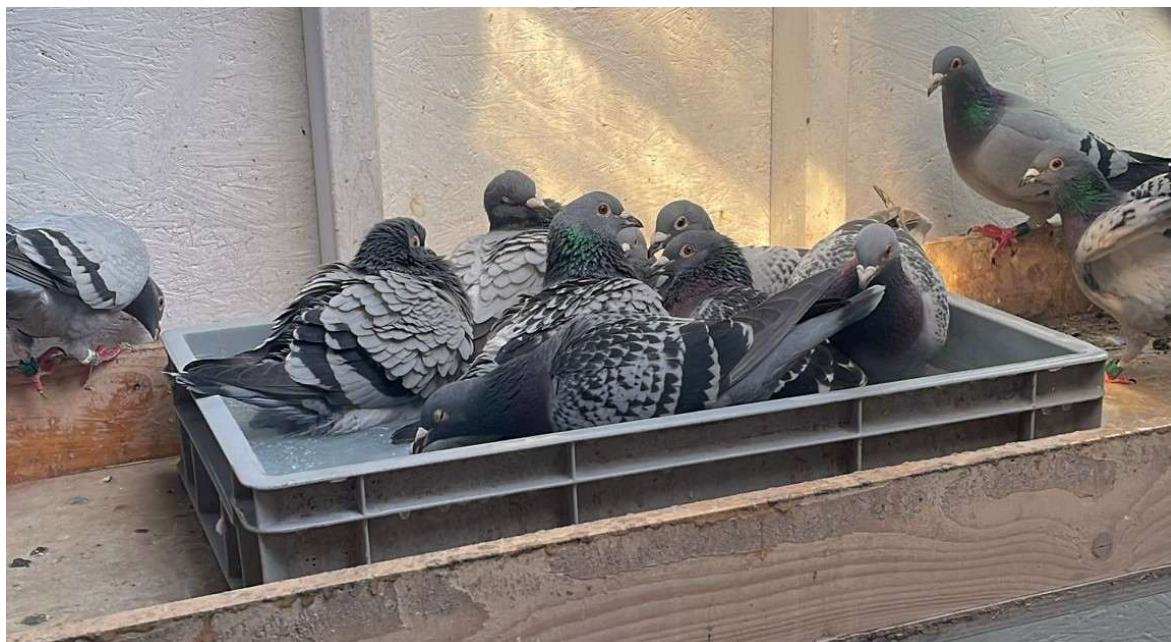
duiven genieten van een bad

Ook onze NPO vindt het belangrijk om het bewustzijn van duivenliefhebbers te vergroten en te versterken. De toenemende aandacht voor dierenwelzijn kan immers consequenties hebben voor onze sport. Daarom denkt de NPO, in samenwerking met de WOWD, na over een dierenwelzijnsplan. Daarin zal ongetwijfeld worden omschreven wat onder een duifwaardig leven moet worden verstaan en wat er van de liefhebber wordt verwacht om daarin te voorzien. Maar wij als liefhebbers kunnen natuurlijk nu al nadenken over wat wij zelf kunnen doen om in de omstandigheden voor een duifwaardig bestaan te voorzien.