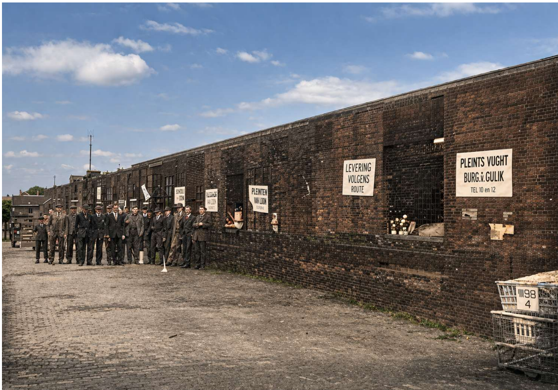
Postduivenvervoer per trein 1925

De eerste wedvlucht vond plaats in 1818, georganiseerd door duivenliefhebbers uit Huy, vanuit het Duitse Frankfurt am Main. In datzelfde jaar werd in Luik de eerste duivenmaatschappij opgericht, die in 1820 haar eerste wedvlucht hield vanaf Parijs. In de beginjaren van de duivensport werden de duiven lopend naar de losplaats gebracht.