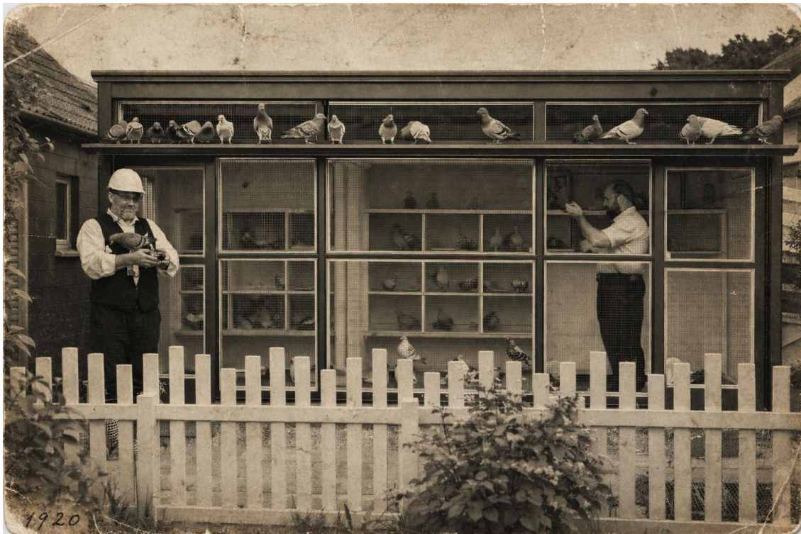
Een hok uit 1920 met voorfront van gaas

Ook tentoonstellingsduiven en hun verzorging komen uitgebreid aan bod. Er is zelfs een uitvoerige jaarkalender in het boek opgenomen, met aanwijzingen voor de verzorging van de duiven van maand tot maand. Ook deze is interessant om door te nemen en tot de conclusie te komen dat er op sommige gebieden veel is veranderd, terwijl op andere gebieden juist weinig is veranderd. Lees in dit kader ook de hoofdstukken met tips en geheimen eens door; ze zijn zeker aan te bevelen.