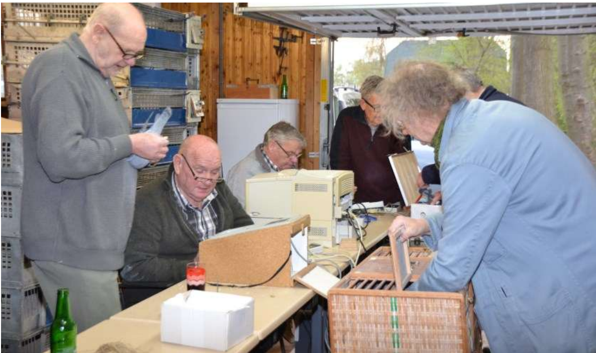
We korven weer in

In de afgelopen 35 jaar, dat we het programma van onze duiven geheel richten op de marathonvluchten, hebben we altijd onze eigen pad gekozen. Is dat het beste pad? Nee hoor ... maar wel het pad dat het beste bij ons past. Bij onze manier van denken, bij onze manier van duiven houden, zelfs bij onze manier van leven: Geen stress, het komt goed met goede duiven in een goede conditie.